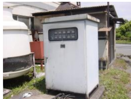
直流電源装置 (屋外型)