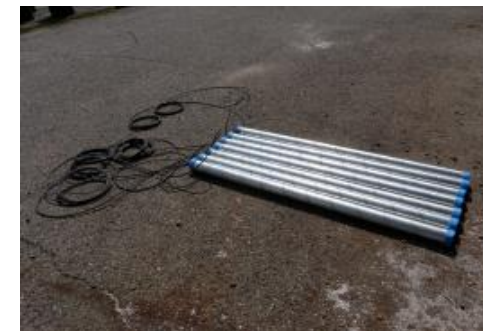
外部電極 (難溶性電極)