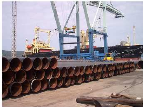
荷降ろしされる被覆鋼管