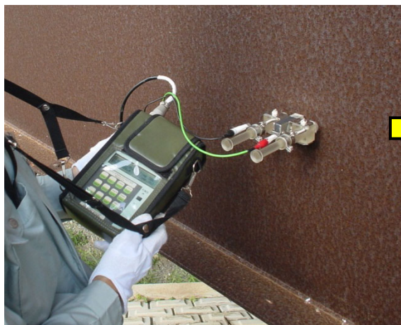
イオン透過抵抗測定装置:RST