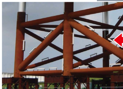
海洋鋼構造物の適用例