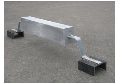
アルミニウム合金陽極外観図

流電陽極には、他にマグネシウム合金陽極、亜鉛合金陽極等があります。中でもアルミニウム合金陽極は海洋・港湾鋼構造物に最も適しております。