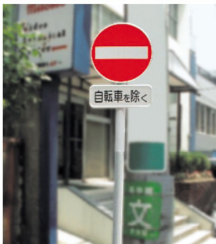
貼紙防止塗装仕様(設置後6ヶ月=貼紙無し)

当社の従来塗装(ポリエステル粉体塗装)の柱は設置後すぐに貼紙(ステッカー)を貼られ美観を損なっていたが、特殊コーティング柱は設置後6ヶ月の定点チェックにおいて貼紙(ステッカー)無し。美観良し!