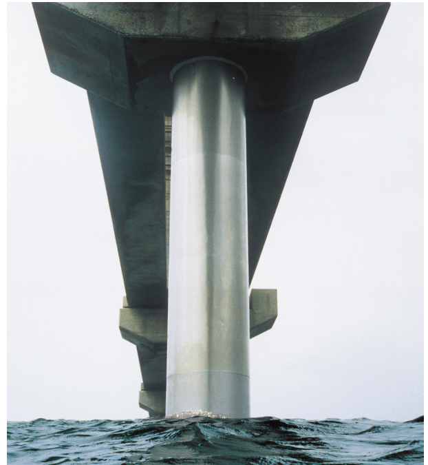
国立研究開発法人 海上・港湾・航空技術研究所 港湾空港技術研究所波崎海洋研究施設