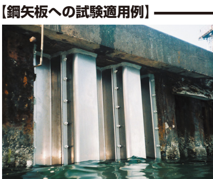
鋼矢板への試験適用例・1