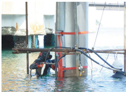
栈橋鋼管杭への施工例 (気中・水中とも溶接施工可能)