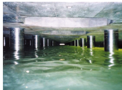
栈橋鋼管杭への施工例