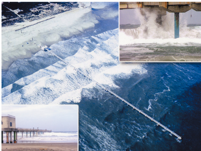
国立研究開発法人 海上・港湾・航空技術研究所 港湾空港技術研究所 波崎海洋研究施設