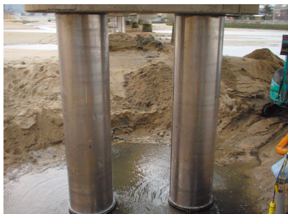
基礎鋼管杭への施工例