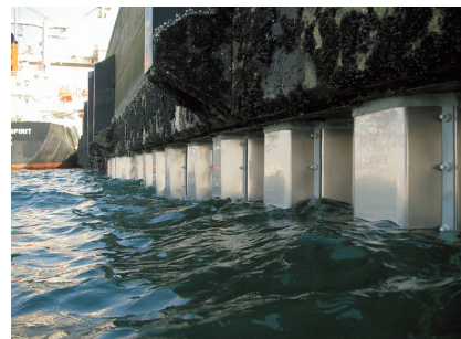
鋼矢板への試験適用例・2