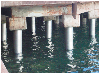
栈橋鋼管杭への施工例