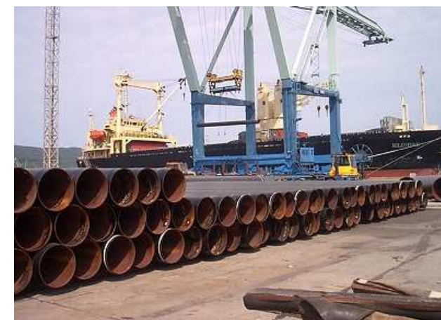
荷降ろしされる被覆鋼管

お問い合わせ先: 被覆事業部国内営業 Tel:03-5858-6012 No.3G3.