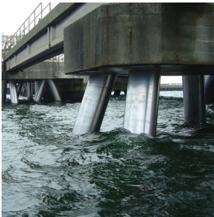
鋼管杭のチタン被覆