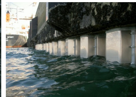
鋼矢板のチタン被覆