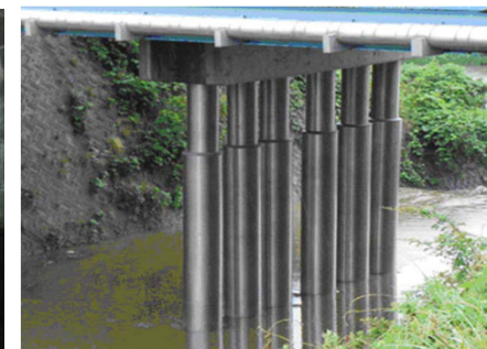
パイルベントのチタン被覆