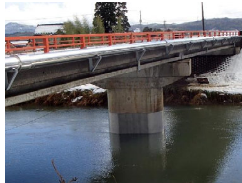
橋脚への施工事例