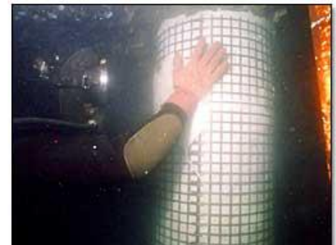
手作業法による事例(小規模)