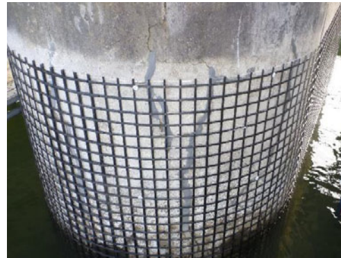
炭素繊維グリッドの設置