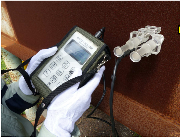
イオン透過抵抗測定装置：RST