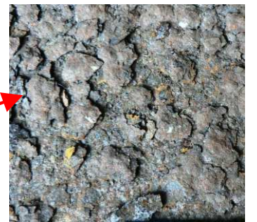
要観察状態を示すさび